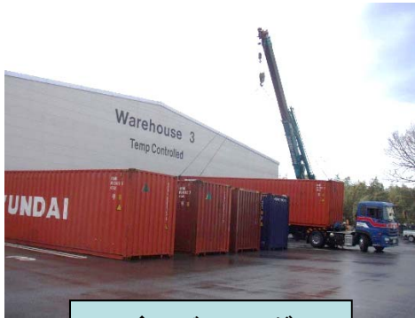
◆ バンニング コンテナ搬出作業